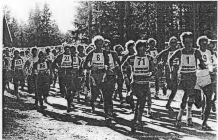
Rovaniemi Hölkä on yksi Roadrunnersien järjestämistä vuotuisista suurtahtumista.

suksista, jotka luonto paljastaa vasta etsivälle.