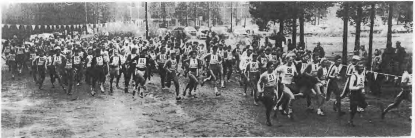
□ Vauhtia ja vipelystä riitti 200 hökkääjän sännätessä matkaan Rovaniemen hökkässä.